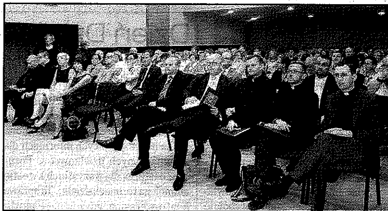
Zebrani goście podczas konferencji „Hospicjum w Służbie Godności Człowieka”.