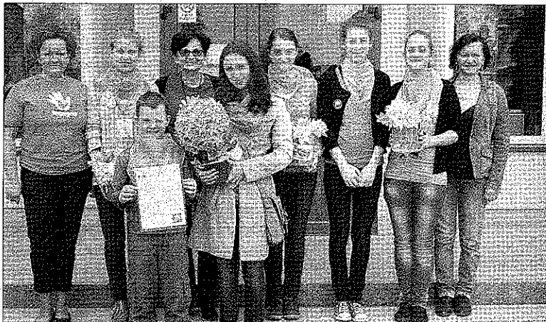
Zespół, który w sobotę przyniósł najcenniejszą puszkę

Pięknie, radośnie i kolorowo było w sobotnie przedpołudnie w Środzie. Królował kolor żółty i żonkile rozdawane przez wolontariuszy w niemalże całej Środzie. Wiosenne podsumowanie akcji „Pola Nadziei” było okazją do tego, by każdy mógł dołożyć swoją cegiełkę do budowy hospicjum. O tym, że jest to nasze wspólne zadanie, wie już wiele osób. Tylko w Środzie udało się zebrać na ten cel ponad 7 tysięcy złotych