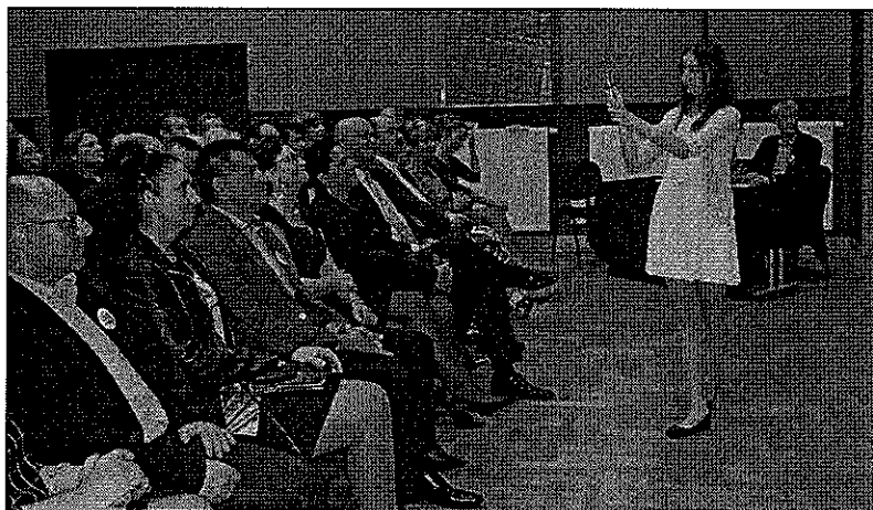
Prezentacja licytowanego przedmiotu. W sumie z licytacji uzyskano 14070 zł i 100 euro.