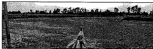
Pierwszy etap robót – zdjęcie warstwy ziemi urodzajnej.

762.190,35 zł, za co dziękuję wszystkim darczyńcom. Aby zrealizować tę piękną i bezinteresowną inicjatywę, która służyć będzie mieszkańcom