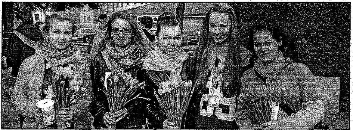
Jedna z grup wolontariuszy chwilę przed wyruszeniem w sobotnie przedpołudnie na ulice Środy.

akcji nastąpi w kwietniu. Wtedy też będzie można ostatecznie podsumować jej efekty i podliczyć zebrane środki.